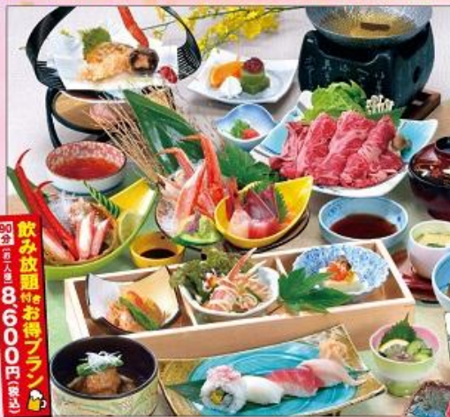
和平 蟹の宴 牛しゃぶ鍋会席 6,500円 (税込7,020円)