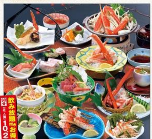
和平 かに寿司・陶板焼き会席 8,000円 (税込8,640円)

送迎バスのご用意承ります。お1人様税込3,240円以上の料理を10名様以上でご予約のお客様に限り 無料送迎 いたします。