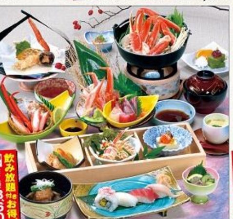
和平 蟹の宴 かに鍋会席 6,500円 (税込7,020円)