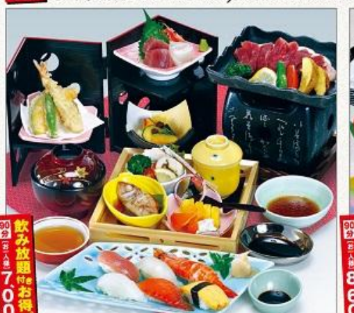
和平 海と山里のご馳走会席 5,000円 (税込5,400円)