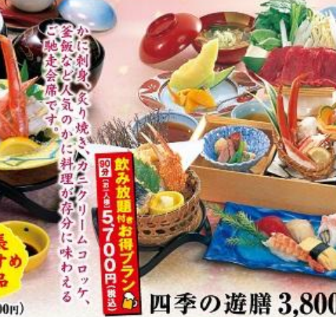
四季の遊膳 3,800円 (税込4,104円)