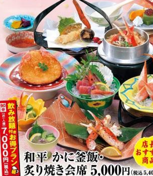
和平 かに釜飯・炙り焼き会席 5,000円 (税込5,400円)